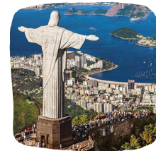
Ρίο Ντε Τζανέιρο