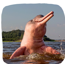
Κολύμπι με ροζ δελφίνια