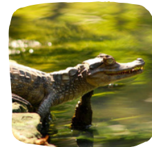
Caiman spotting (αλιγάτορες)