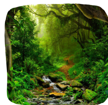
Διανυκτέρευση στη ζούγκλα