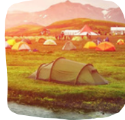
Διαμονή σε καταφύγιο