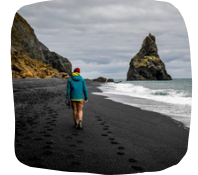
Black Sand Beach